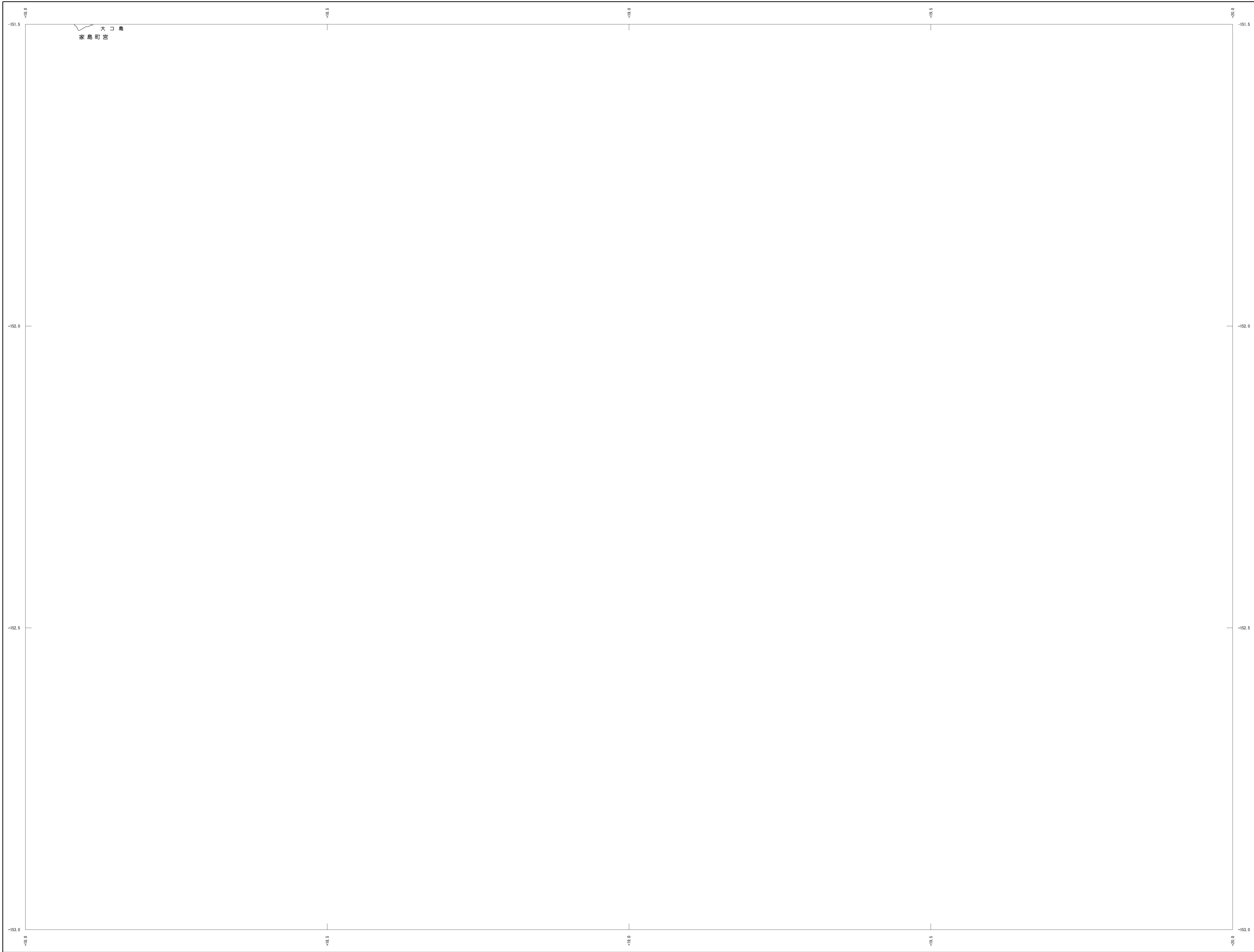
1:2,500 姫路市基本地形図 V-PE 044